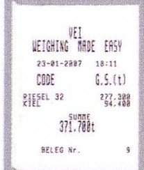
Muster der Ausdrücke