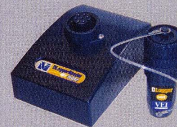
DLogger Kit für den Datentransfer zum PC